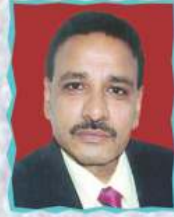
सी.ए. विष्णुकांत मंत्री उपाध्यक्ष